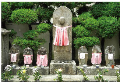
江戸時代前期に建立された 地藏菩薩像 (子宝地藏)