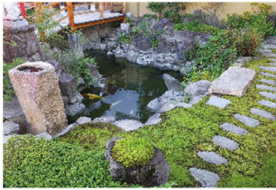
宮本武蔵 作のお庭