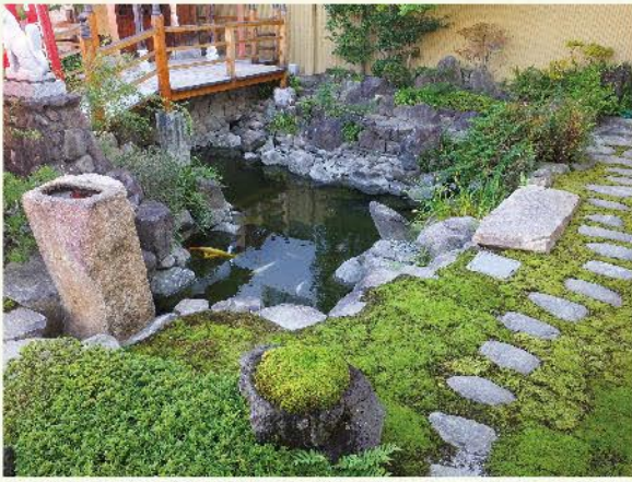
宮本武蔵 作のお庭