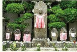
江戸時代前期に建立された地藏菩薩像(子宝地藏)

子宝のご縁を結ぶと言われる地藏菩薩像も多くの方に親しまれています。坐禅会や婚活行事も行っております。