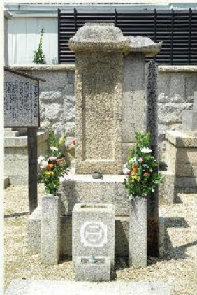
里見忠義公供養塔

兵庫県明石市の月江山雲晴寺(げっこうざん うんせいじ)は、曹洞宗(禅宗)の寺院です。南総里見八犬伝のモデルとなった里見忠義公の供養塔があり、明石藩の家老を奉る菩提寺です。