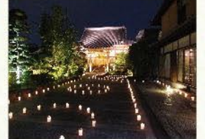
お盆の燈明会(8月15日)

「慈縁」「慈雲」は読経が聞こえる雲晴寺境内にあり、遠い将来の安心まで確保します。お寺だからできる供養があります。